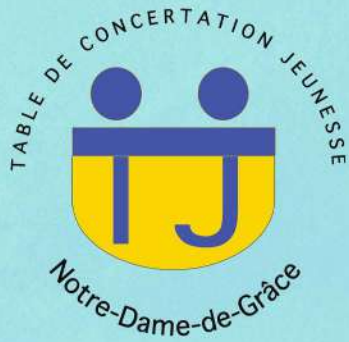
Table de concertation jeunesse Notre-Dame-de-Grâce

La Table de concertation jeunesse NDG (TJNDG) est un regroupement d'organismes de NDG qui travaillent auprès des jeunes de 6 à 30 ans et leur famille. Elle a pour mission de rassembler les organismes et institutions afin de soutenir et consolider le travail qui se fait auprès des jeunes. Elle cherche aussi à promouvoir et encourager les actions visant à améliorer la qualité de vie et la santé de la population ciblée.