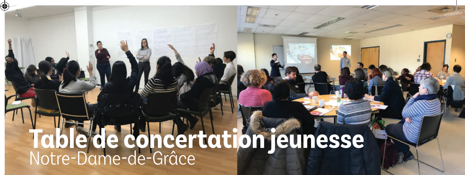
Table de concertation jeunesse Notre-Dame-de-Grâce